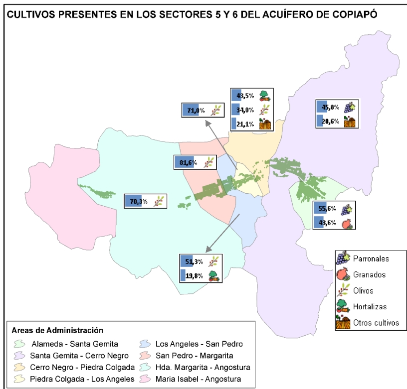
Figura 2. Información de cultivos y tipo de riego levantada a la fecha para el área de jurisdicción de la CASUB.

En la Figura 2 se presenta un resumen de la información levantada hasta el momento.